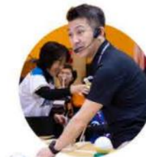
審判と進行は お任せください