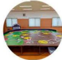
大きめの会議室以上の 広さでOK